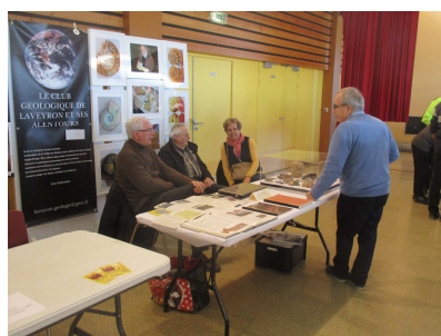
Le Stand Géologie Laveyronnaise