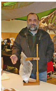
JP Soustelle et le « gypse »

L'association a participé le 8 et 9 février au salon du CAP (Collectif des Associations du Patrimoine) à Alixan en présentant sur le stand photos et ouvrages sur la géologie ainsi qu'un travail sur l'eau, sujet repris par plusieurs associations de patrimoine.